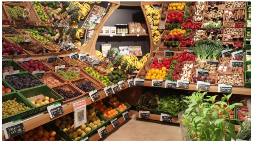
Der kleine Frischemarkt