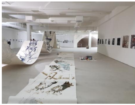
1000qm Fläche „auf Augenhöhe“