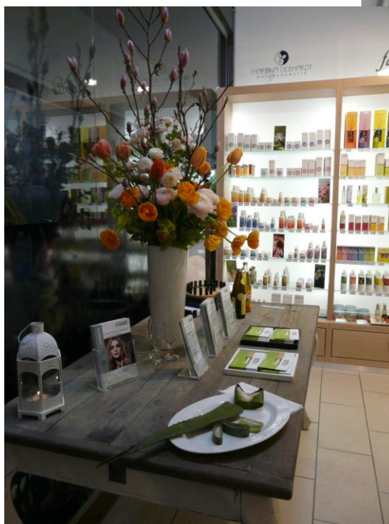
Naturkosmetik mit Behandlungsraum