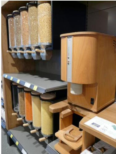
Unverpackt in Glasbins